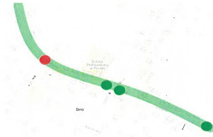
Rys. 1: Przejścia dla pieszych na ul. Głównej na odcinku od szosy Mosińskiej do przejazdu kolejowego. Kolor zielony - istniejące, kolor czerwony - brakujące

Obecnie na ulicy Głównej na odcinku od Szosy Mosińskiej do przejazdu kolejowego znajdują się tylko 2 przejścia dla pieszych co powoduje że mieszkańcy przechodzą przez jezdnię w miejscach nie przeznaczonych do tego celu..