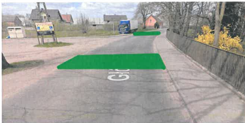
Rys 2.: Proponowane miejsce dla przejścia dla pieszych u zbiegu ulic Łąkowej i Głównej w Pecnej