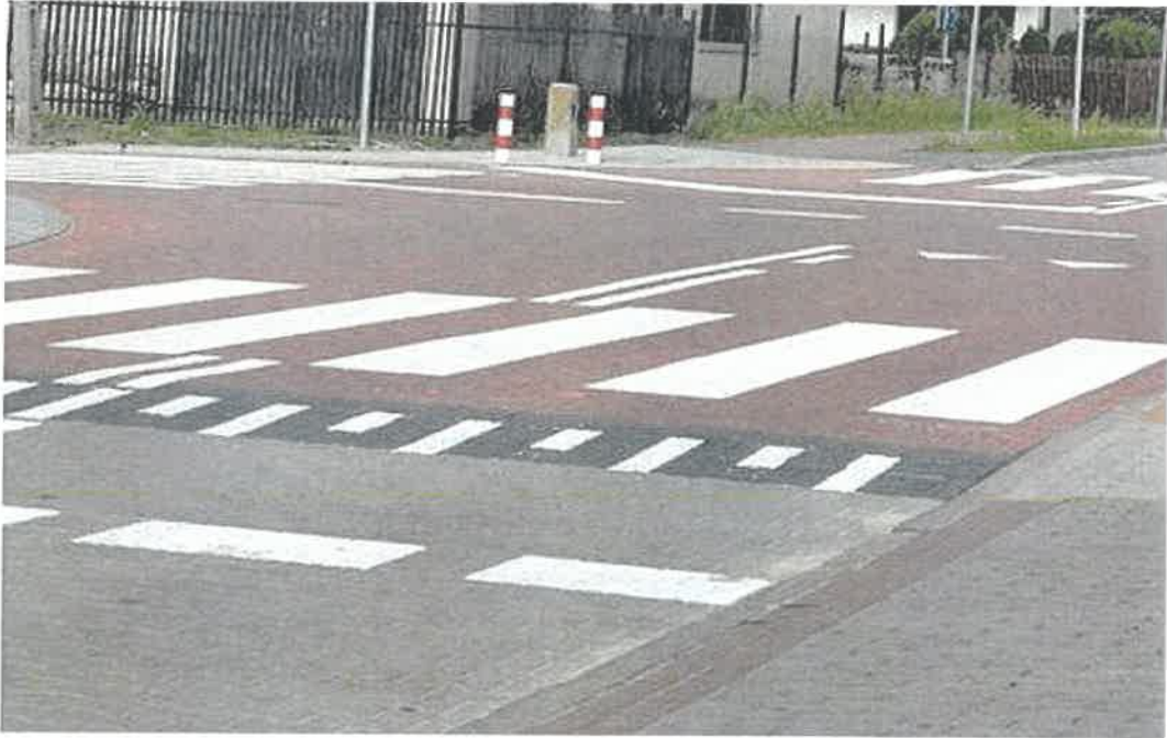
Rys. 3: Proponowane rozwiązanie dla skrzyżowania ul. Głównej z ul. Szkolną i Łąkową

2. Wybudowanie na skrzyżowaniu ulicy Głównej z ul. Szkolną i Kozią podwyższonego skrzyżowania: